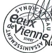
Nathalie DELLA VALLE

Dans le cadre du RGPD, Eaux de Vienne exploite les données recueillies afin de traiter votre demande de diagnostic. Pour plus d'informations sur la gestion de vos données personnelles, vous pouvez retrouver notre politique de protection des données sur notre site internet : www.eauxdevienne.fr/donnees-personnelles