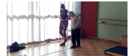
Atelier de POITIERS (Octobre 2017 à février 2018)